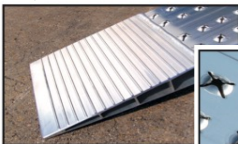
Angle d'attaque inférieur à 5 mm